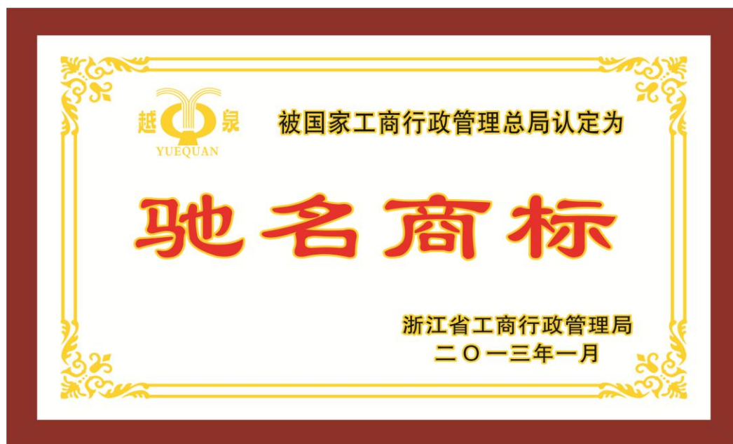
图 1 中国驰名商标证

鼎丰纺器以其良好的产品质量奠定了“越泉”品牌基础，不仅获得顾客的认可，在社会上也有较高的知名度和美誉度，并且也得到了国家和社会各界的高度认可。“越泉”商标 2013 年被国家工商行政管理总局认定为中国驰名商标，“越泉”牌喷气箱和钢片综产品分别在 2010 年和 2012 年被认定为浙江省名牌产品。“越泉”牌铝合金综框在 2016 年被认定为浙江省名牌产品。2017 年喷气箱荣获“浙江制造”认证。2018 年织机用铝合金综框荣获“浙江制造”认证。